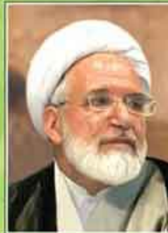
حجت الاسلام والمسلمین مهدی کروبی رئیس مجلس شورای اسلامی در دوره های سوم و هفتم