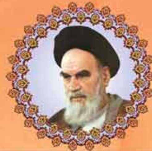
رهبر معظم انقلاب اسلامی حضرت آیت الله خامنه ای (مدظله العالی)