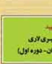
شهید محمد نصیری لاری (نماینده لارستان - دوره اول)