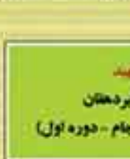
شهید علی اکبر دهقان (نماینده تربت جام - دوره اول)