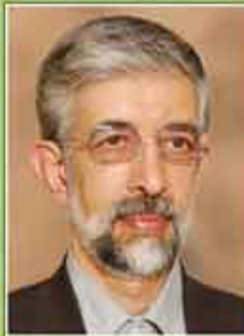
دکتر غلامعلی جعفری جادو عادل رئیس مجلس شورای اسلامی در دوره هفتم