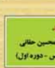
شهید حجت الاسلام فلاح حسین حقانی (نماینده بندر عباس - دوره اول)