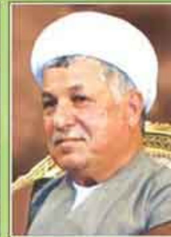
آیت الله اکبر هاشمی رفسنجانی رئیس مجلس شورای اسلامی در دوره های اول، دوم و سوم

■ در شور دوم درباره اصل مواد، مذاکره به عمل نمی آید مگر آن که در گزارش کمیسیون مواد جدیدی اضافه شده باشد یا به تشخیص هیأت رئیسه در بعضی مواد تغییرات اساسی داده شده باشد. در این صورت اولین مخالف و موافق (بر اساس تابلو مخصوص ثبت نام یادستگاه الکترونیک) هر یک به مدت پنج دقیقه صحبت می کنند و در صورت لزوم مخبر یا نماینده دولت نیز صحبت می کند و آنگاه نسبت به ماده یا مواد مورد نظر رأی گیری می شود. (ماده ۱۵۳ آئین نامه داخلی)