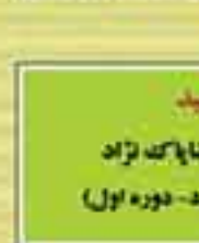
شهید دکتر سید رضا پاکت نژاد (نماینده بروجرد - دوره اول)