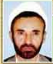
شهید حجت الاسلام دکتر قاسم صادقی (نماینده مشهد - دوره اول)