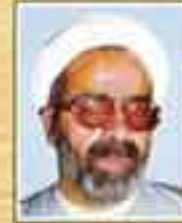
شهید حجت الاسلام دکتر غلامرضا دانش (نماینده لفرش و آشتیان - دوره اول)