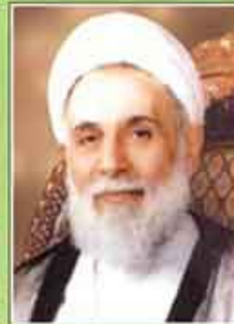
حجت الاسلام والمسلمین علی اکبر باقری رئیس مجلس شورای اسلامی در دوره های سوم و هفتم