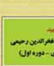
شهید حجت الاسلام سید فخرالدین رحیمی (نماینده ملای - دوره اول)