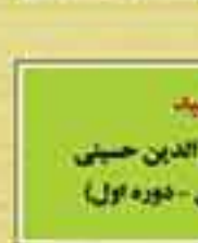
شهید دکتر سید شمس الدین حسینی (نماینده نائین - دوره اول)