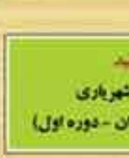
شهید میرزا ادشهر باری (نماینده رودباران - دوره اول)