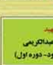
شهید سید الله عبدالکریمی (نماینده لنگرود - دوره اول)