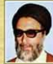
شهید حجت الاسلام سید محمد تقی حسینی طباطبایی (نماینده زابل - دوره اول)