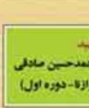
شهید حجت الاسلام محمد حسین صادقی (نماینده کرد وازان - دوره اول)