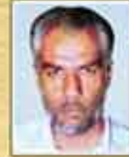
شهید عباس حیدری (نماینده نوشهر - دوره اول)