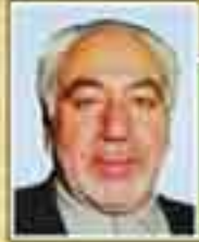
شهید سید محمد جواد شرافت (نماینده شوشتر - دوره اول)