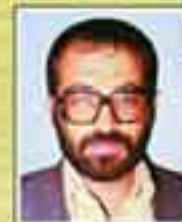
شهید رحسان استکی (نماینده تهران - دوره اول)