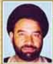
شهید حجت الاسلام سید نور الله طباطبایی نژاد (نماینده اردستان - دوره اول)