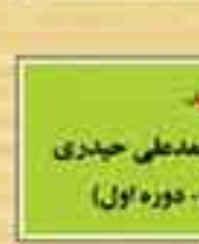
شهید حجت الاسلام محمد علی حیدری (نماینده نهاوند - دوره اول)