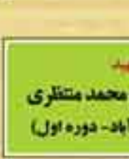
شهید حجت الاسلام محمد منتظری (نماینده نجف آباد - دوره اول)