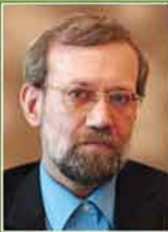
دکتر علی لاریجانی رئیس مجلس شورای اسلامی در دوره هفتم