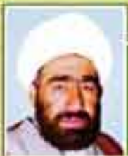
شهید حجت الاسلام محمد حسن طیبی (نماینده اسفراین - دوره اول)