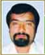
شهید دکتر سید محمد باقر لویسانی (نماینده تهران - دوره اول)