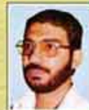
شهید علیرضا چراغ زاده ترقولی (نماینده رامهرمز - دوره اول)