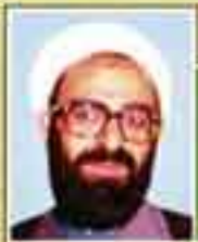
شهید حجت الاسلام عبدالوهاب قاسمی (نماینده باری - دوره اول)