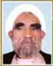
شهید حجت الاسلام علی هاشمی سبحانی (نماینده ارومک - دوره اول)