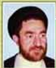
شهید حجت الاسلام سیدمحمد کاظم دانش (نماینده شوش و اندیمشک - دوره اول)