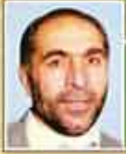
شهید مصطفی ناطق لوری (نماینده سوادکوه - دوره اول)